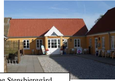
Motiv fra Samsø og Stensbjerggård

Den første dag blev hovedsageligt brugt til transport via Kalundborg til Samsøfærgen, og efter ankomsten til Kolby Kås kørte vi til Brundby Hotel, hvor vi spiste frokost. Og efter frokosten fortsatte vi til Ballen Havn, hvor vi havde et ophold før vi fortsatte til Stensbjerggård Feriecenter, hvor vi boede under vort ophold på Samsø.