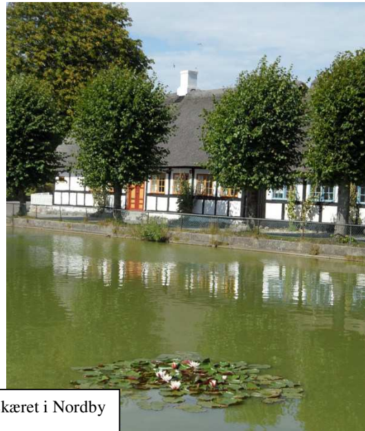
Gadekæret i Nordby

Lørdag aften kørte vi en solnedgangstur til Ilsa Made Helligkilde, der er et meget specielt fortidsminde. Kilden er ca. 1 meter i diameter og den består af en udhulet egestræsstamme, der er gravet 90 cm. Ned i sandet. En kulstof 14 prøve fra træet gav det resultat, at træet er fra år 940 før Kristus. Et sagn fortæller, at et kors var bundet til en død kvinde, der drev i land på stedet, og da man ville føre kvinden til kirkegården, kunne end ikke 4 heste trække hende mod Tranekær Kirke. Først da man gik mod Onsbjerg Kirke, kunne man transportere den døde kvinde til Onsbjerg Kirkegård, hvor hun blev begravet.