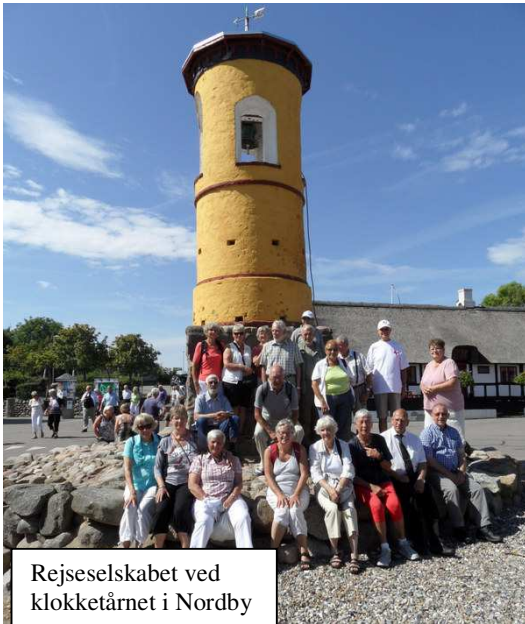
Rejseselskabet ved klokketårnet i Nordby

Byen Nordby er en meget smuk by, hvor de gamle huse er placeret omkring et gadekær. Fra Nordby fortsatte vi via Tranebjerg til Vesborg Fyr, der er opført på den sydøstlige kyst af Samsø. Fyret er 19 meter højt, og det er bygget på en høj klint. På vej tilbage til Stensbjerggård gjorde vi holdt ved Kolby Mølle, en mølle der er indrettet som museum.