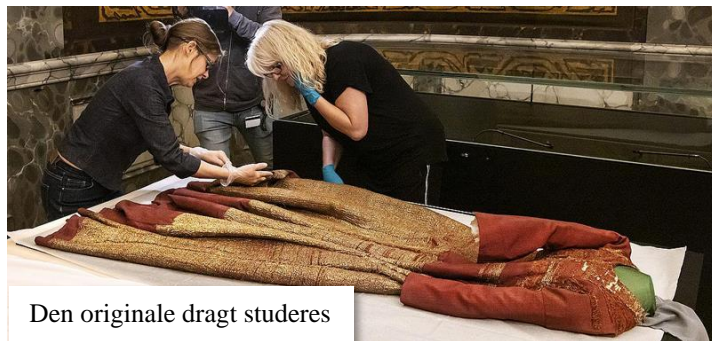
Den originale dragt studeres

På fotoet her til venstre ses en kopi af Margrethe den Førstes gyldne kjole. Den originale kunne også ses på udstillingen, men opbevares normalt i Uppsala Domkyrka, da den blev røvet som krigsbytte fra Roskilde Domkirke i 1658. Det er den eneste kvindelige hofdragt fra middelalderen, der er bevaret og er derfor et stort klenodie