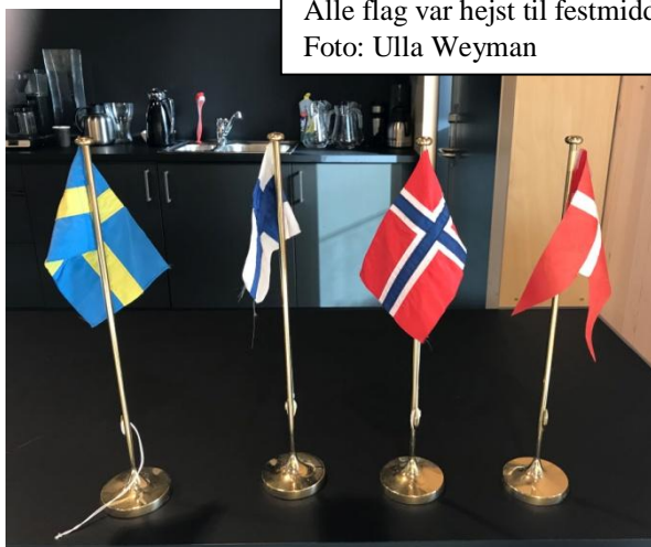
Alle flag var hejst til festmiddagen

Udgivet af Foreningen Norden Fredensborg lokalafdeling norden.fredensborg@gmail.com