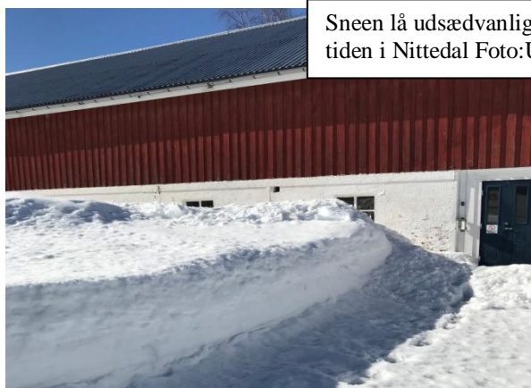
Sneen lå udsædvanligt højt for årstiden i Nittedal

Der blev i marts måned afholdt en Nordisk Musikfestival i Nittedal . Det var en stor succes med workshops og koncerter med deltagere fra de nordiske venskabsbyer - børn, unge og voksne. Nittedal var en strålende vært og kunne med stolthed fremvise deres nye kulturhus Flammen, der rummer koncertsal, bibliotek, musikskole og kirke. Læs mere om festivalen i artiklen side 4-5.