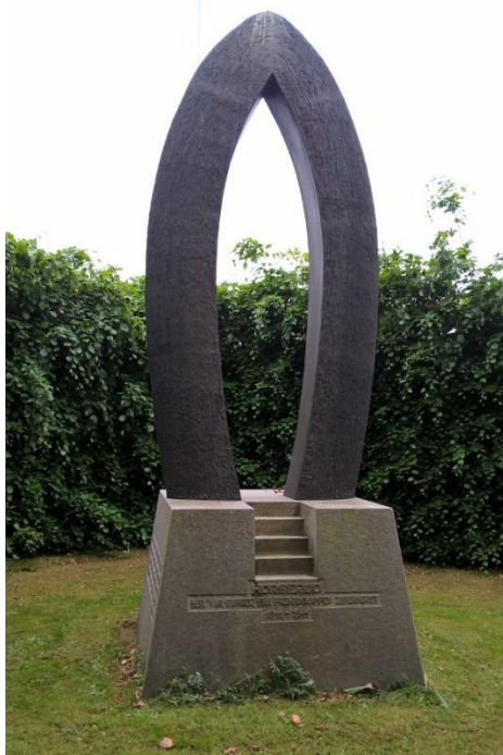
Denne mindesten står ved Horserød-lejren og er til minde om de internerede under anden verdenskrig.