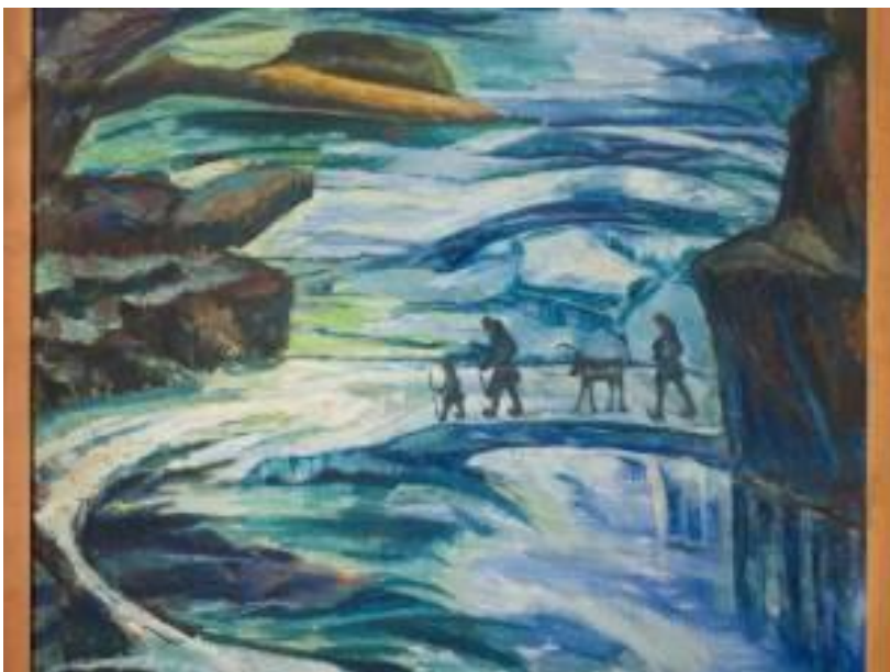
Med samerne i højjældet. Malet i 1944.