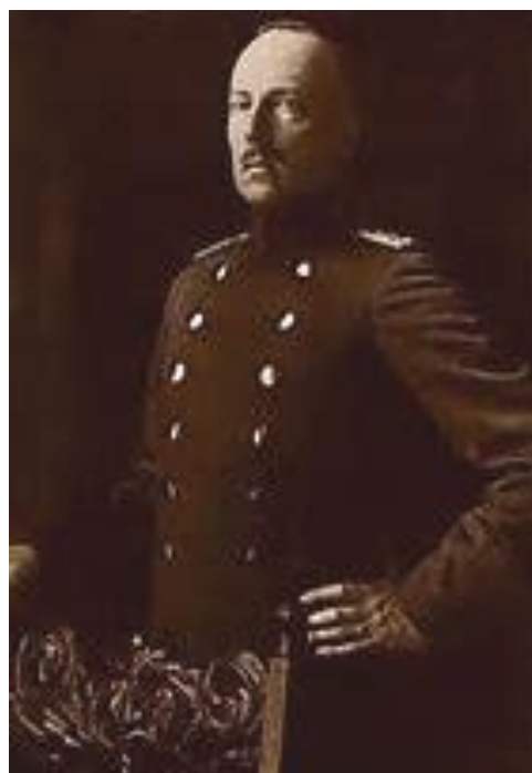
Karl den Første, konge af Finland og Karelen, hertug af Åland, storfyrste af Lapland og herre af Kalevala og Norden – i 2 måneder