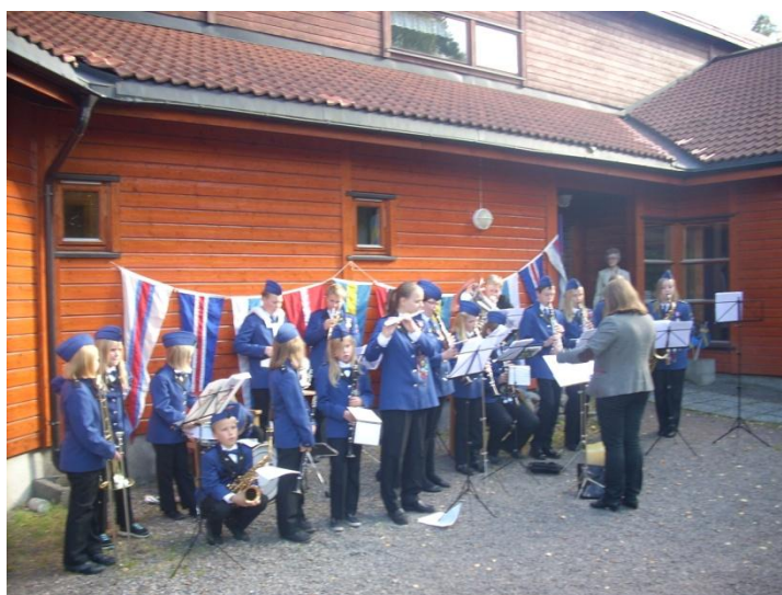
Foreningen Nordens 30 års jubilæum i 2012 i Nittedal

Indholdet af musikfestivalen vil blandt andet bestå af en række workshops for børn og voksne, som gæsterne kan deltage i. Musikfestivalen foregår hovedsageligt i det nybyggede kulturhus Flammen i Nittedal, der har funktion af både musikskole og bibliotek.